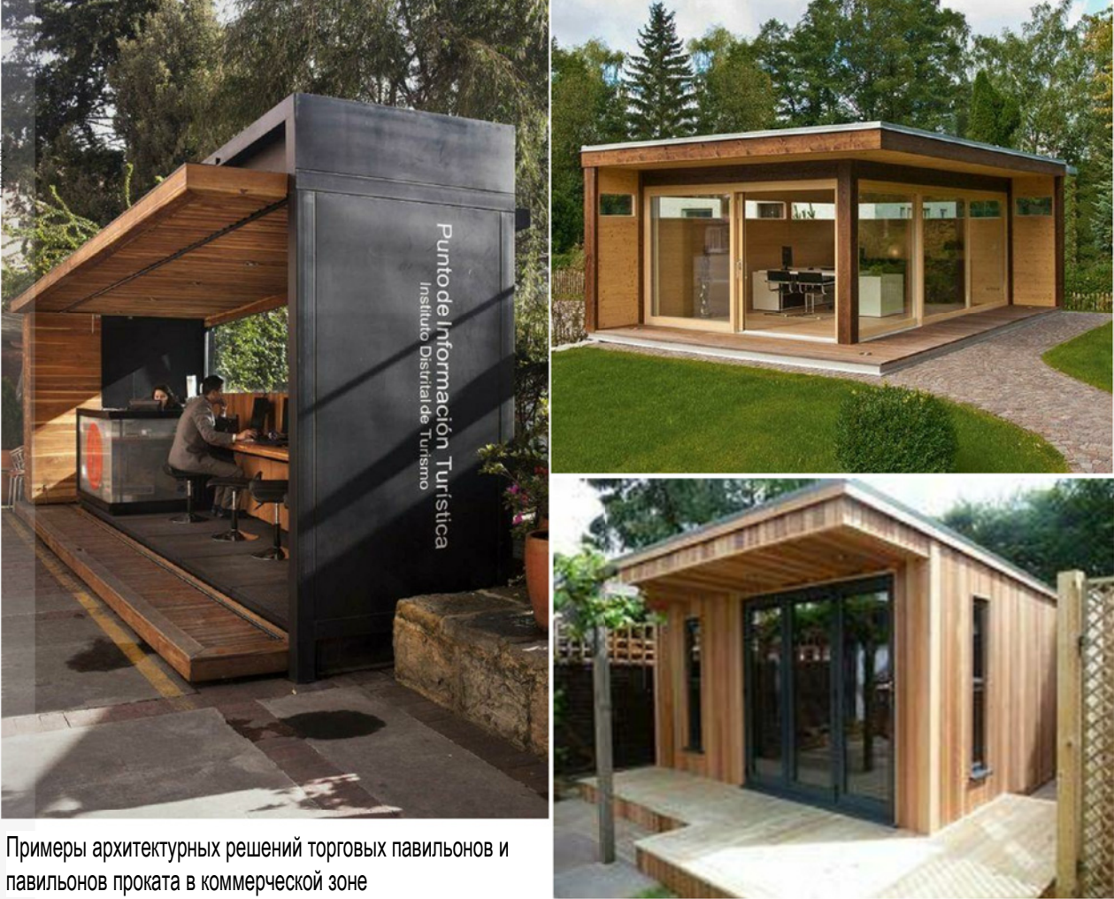
Примеры архитектурных решений торговых павильонов и павильонов проката в коммерческой зоне

Количество объектов малого бизнеса в коммерческой зоне: 6-8; Количество рабочих мест: 18-25